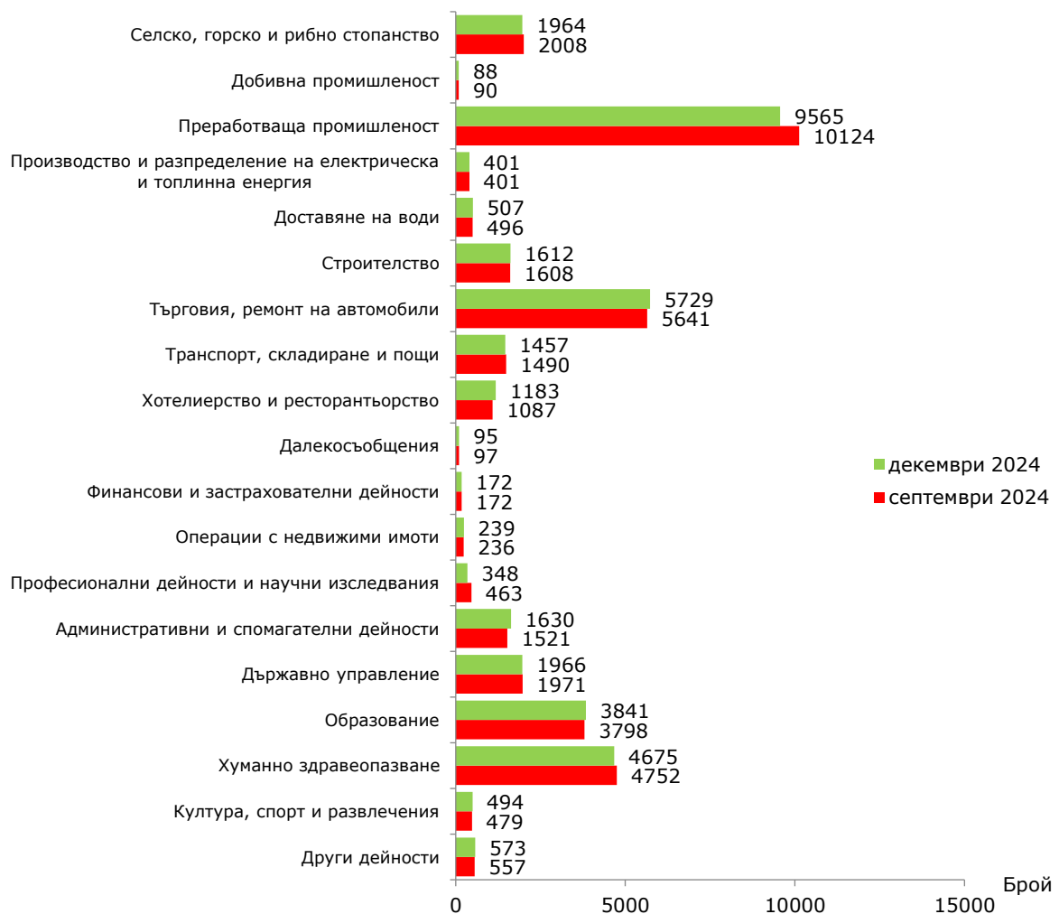
Фиг. 1. Наети лица по трудово и служебно правоотношение в област Сливен към края на септември и декември 2024 година

По предварителни данни на Националния статистически институт броят на наетите лица по трудово и служебно правоотношение в област Сливен към края на декември 2024 г. намалява с 0.5 хил., или с 1.2%, спрямо края на септември 2024 г., като достига 36.5 хиляди (фиг. 1).