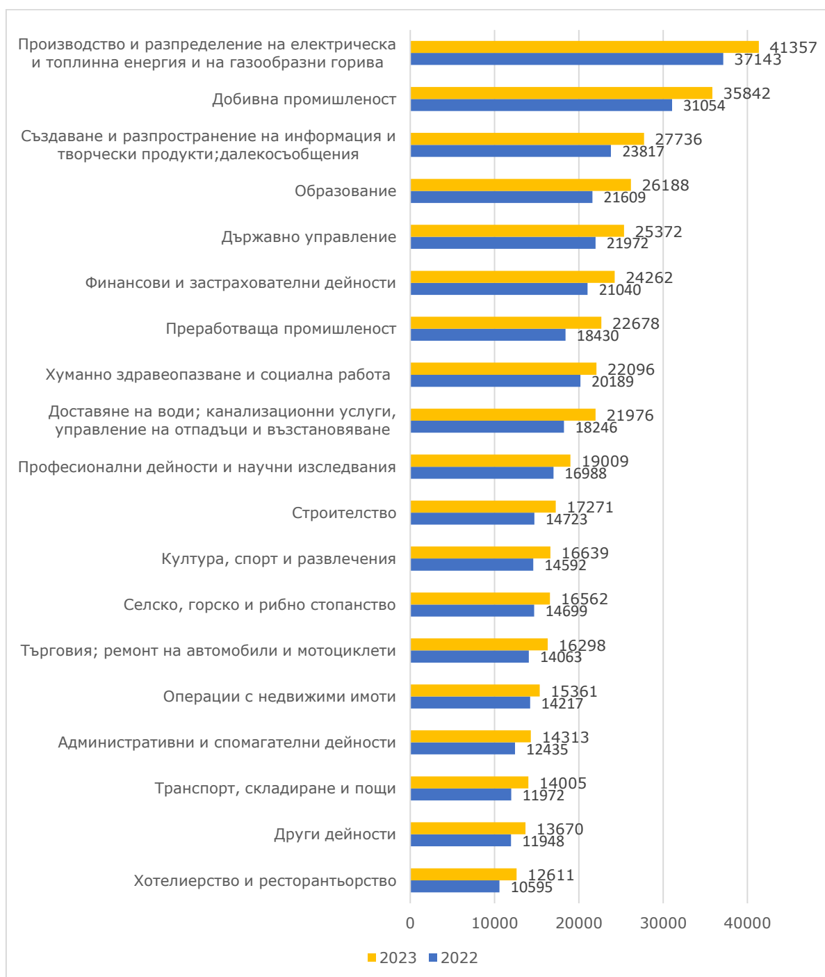
Фиг. 2. Средна брутна годишна заплата на наетите лица по трудово и служебно правоотношение по икономически дейности – левове

Средната брутна годишна работна заплата в област Стара Загора през 2023 г. е 22 234 лева при 24 485 лева за страната. В сравнение с 2022 г. средната работна заплата в областта нараства със 17.1%, в общественения сектор – с 15.2%, а в частния – с 18.5%. Икономическите дейности, в които е регистрирано най-голямо увеличение са „Преработваща промишленост“ – с 23.0%, „Образование“ – с 21.2% и „Доставяне на води; канализационни услуги, управление на отпадъци и възстановяване“ – с 20.4%.