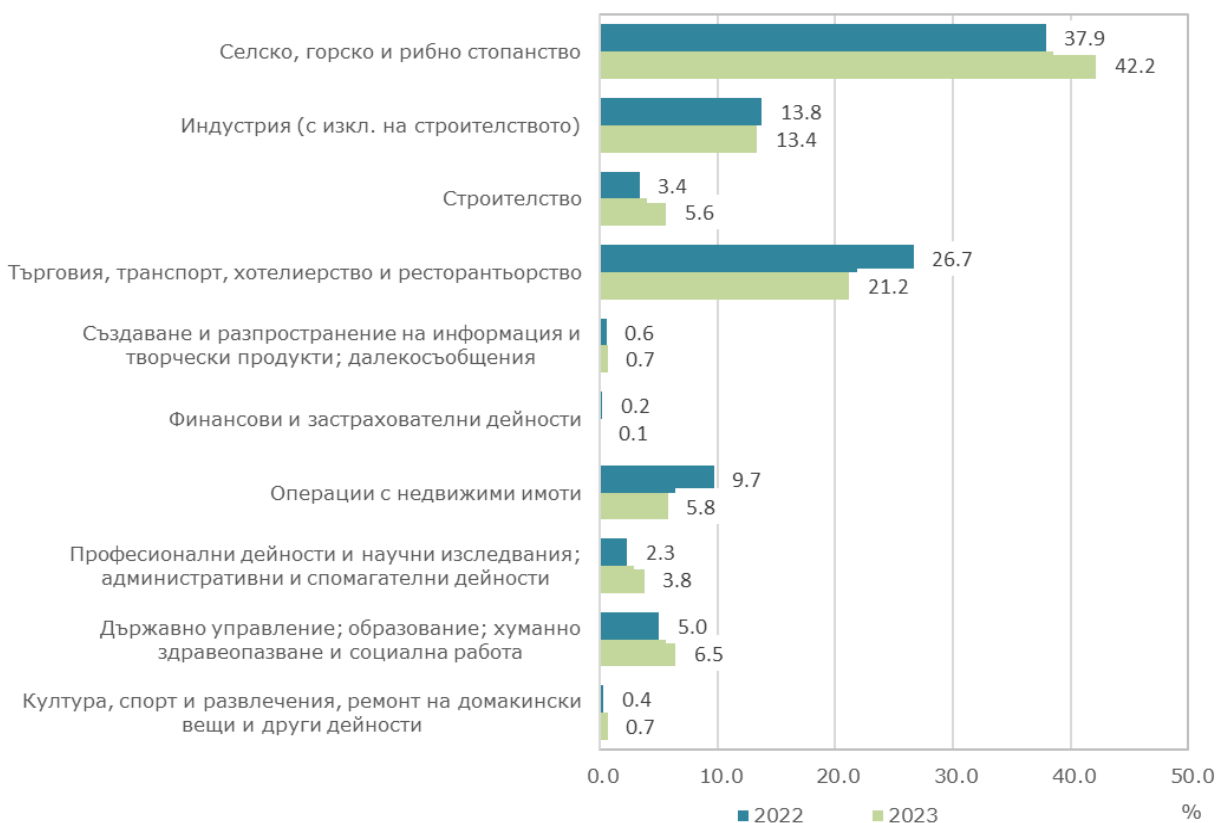
Фиг. 1. Структура на разходите за придобиване на дълготрайни материални активи през 2022 и 2023 година по икономически дейности

Най-голям обем инвестиции в ДМА са вложени в сектор селско, горско и рибно стопанство - 189.7 млн. лв., и в сектора на услугите (търговия, ремонт на автомобили и мотоциклети, транспорт, складиране и пощи, хотелиерство и ресторантьорство) - 95.6 млн. лв., както и в сектор индустрия (добивна, преработваща и друга промишленост; доставяне на води; канализационни услуги, управление на отпадъци и възстановяване) - 60.2 млн. лева. През 2023 г. тези сектори заедно формират 76.8% от общия обем разходи за ДМА. В сектор „Строителство“ инвестициите за ДМА са 25.4 млн. лв. и са с 54.7% повече в сравнение с 2022 година.