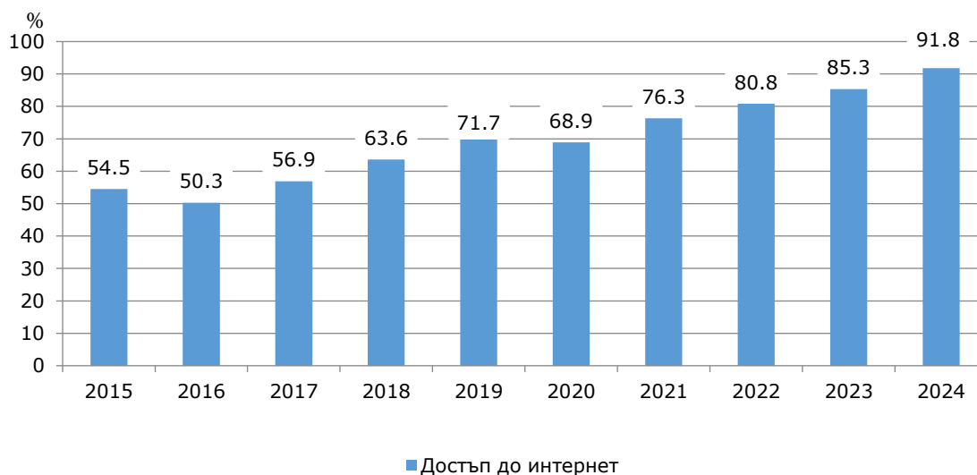
Фиг. 1. Относителен дял на домакинствата с достъп до интернет в област Плевен по години

През 2024 г. 87.5% от лицата на възраст между 16 и 74 навършени години в област Плевен използват интернет всеки ден или поне веднъж седмично на работа, вкъщи или на друго място. В регулярното използване на интернет от лицата в сравнение с предходната година е регистриран ръст от 4.1 проценти пункта.