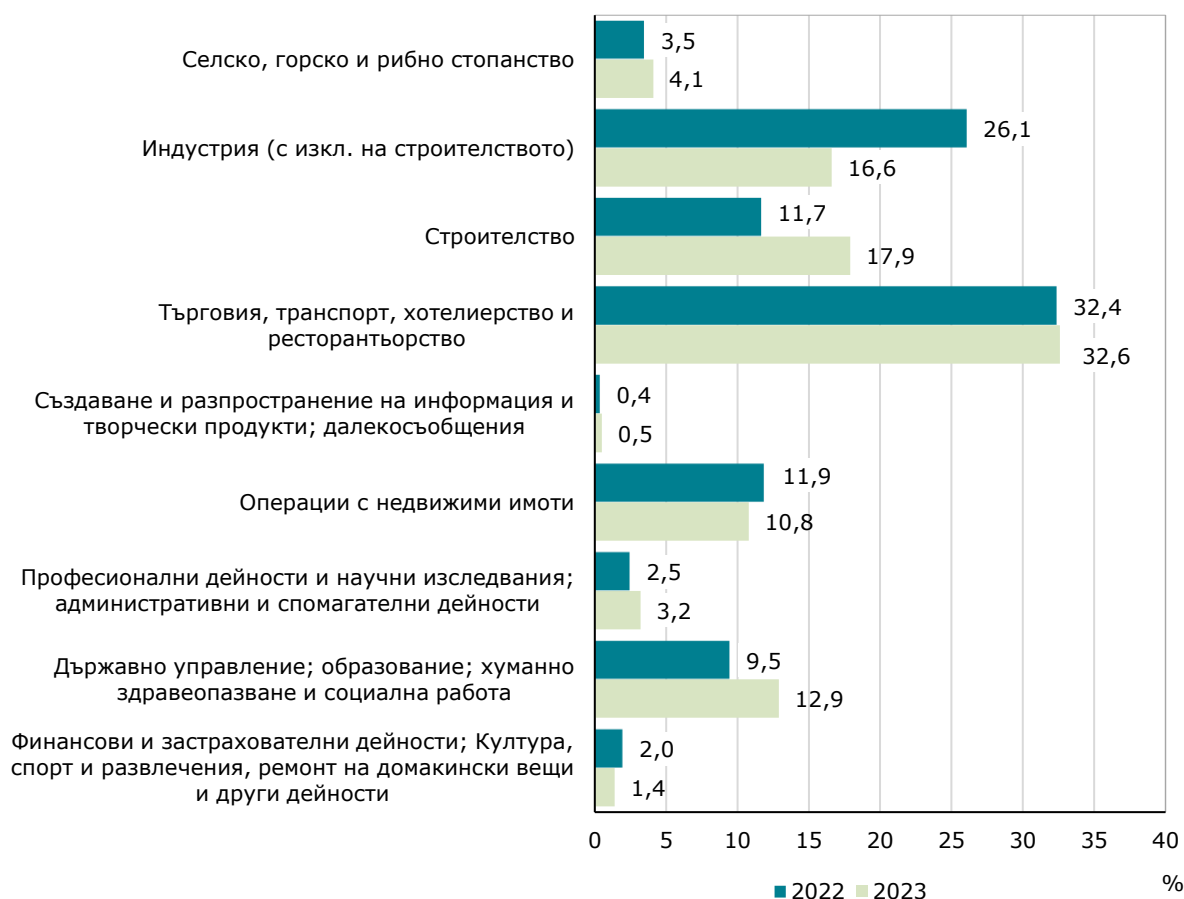
Фиг. 1. Структура на разходите за придобиване на дълготрайни материални активи през 2022 и 2023 г. в област Благоевград по икономически дейности

Най-голям обем на инвестиции в ДМА са вложени в сектора на услугите (търговия; ремонт на автомобили и мотоциклети; транспорт, складиране и пощи; хотелиерство и ресторантьорство) - 261.8 млн. лева., което е с 15.1% повече в сравнение с 2022 година. Следващ по обем на направените инвестиции за ДМА е строителството – 143.2 млн. лева, или с 74.7% повече в сравнение с предходната година.