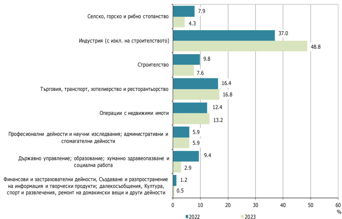
Фиг. 1. Структура на разходите за придобиване на дълготрайни материални активи през 2022 и 2023 г. в област Перник по икономически дейности

Най-голям обем на инвестиции в ДМА са вложени в сектора на индустрията (добивна, преработваща и друга промишленост; доставяне на води; канализационни услуги, управление на отпадъци и възстановяване) - 195.4 млн. лв., което е с 91.9% повече в сравнение с 2022 година. В структурата на разходите за придобиване на дълготрайни материални активи по икономически дейности през 2023 г. се наблюдава спад на направените инвестиции в сектор „Селско, горско и рибно стопанство“ и „Държавно управление; образование; хуманно здравеопазване и социална работа“ съответно с 3.6 и 6.5 процентни пункта.