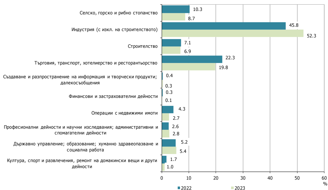
Фиг. 1. Структура на разходите за придобиване на дълготрайни материални активи в област Стара Загора през 2022 и 2023 г. по икономически дейности

През 2023 г. в структурата на разходите за придобиване на ДМА по икономически дейности се наблюдава нарастване на направените инвестиции в сектора на индустрията (с изкл. на строителството), като относителният им дял се увеличава с 6.5 процентни пункта в сравнение с 2022 г., и спад в сектора на операциите с недвижими имоти с 1.6 процентни пункта.