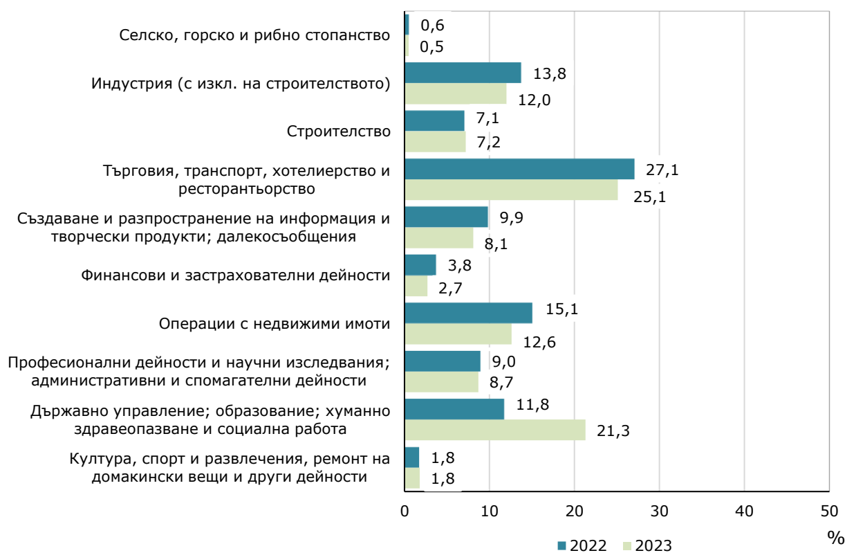
Фиг. 1. Структура на разходите за придобиване на дълготрайни материални активи през 2022 и 2023 г. в област София (столица) по икономически дейности

Най-голям обем на инвестиции в ДМА са вложени в сектора на услугите (търговия; ремонт на автомобили и мотоциклети; транспорт, складиране и пощи; хотелиерство и ресторантьорство) - 3 513.0 млн. лв., което е с 15.4% повече в сравнение с 2022 година. В структурата на разходите за придобиване на дълготрайни материални активи по икономически дейности през 2023 г. се наблюдава спад на направените инвестиции в сектор „Търговия, транспорт, хотелиерство и ресторантьорство“ и „Операции с недвижими имоти“ съответно с 2.0 и 2.5 процентни пункта.