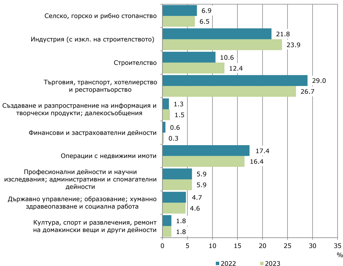
Фиг. 1. Структура на разходите за придобиване на дълготрайни материални активи през 2022 и 2023 година по икономически дейности

Най-голям обем инвестиции в ДМА са вложени в сектора на услугите (търговия, ремонт на автомобили и мотоциклети, транспорт, складиране и пощи, хотелиерство и ресторантьорство) - 411.4 млн. лв., следван от сектора на индустрията (с изкл. на строителството) с 367.2 млн. лева. През 2023 г. тези сектори заедно формират 50.6% от общия обем разходи за ДМА.