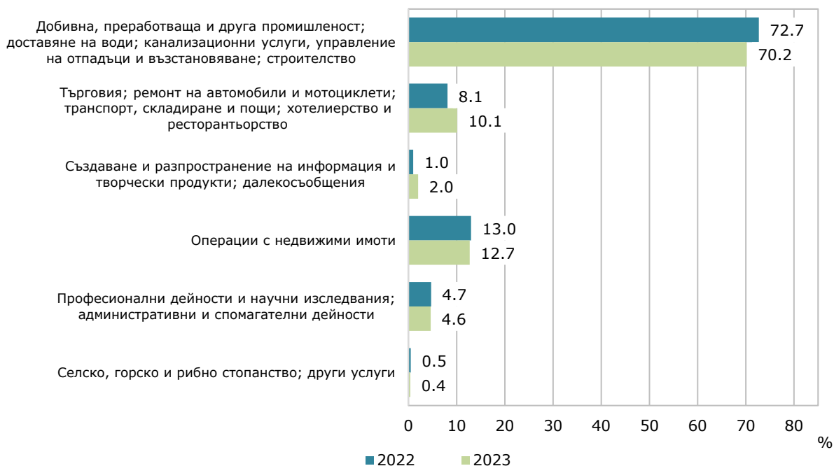
Фиг. 1. Структура на преките чуждестранни инвестиции в предприятията от нефинансовия сектор по икономически дейности към 31.12.

С най-голям размер на ПЧИ е община Пловдив - 58.3% от общия обем, следвана от Марица и Първомай - съответно 17.4% и 6.5%.