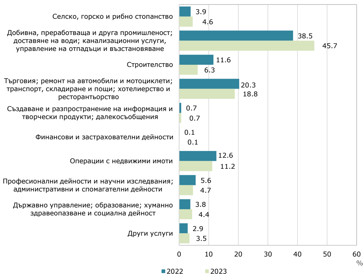
Фиг. 2. Структура на разходите за придобиване на дълготрайни материални активи през 2022 и 2023 г. по икономически дейности

Най-голям обем инвестиции в ДМА са вложени в промишления сектор - 1 694 млн. лв., и в сектора на услугите (търговия, ремонт на автомобили и мотоциклети, транспорт, складиране и пощи, хотелиерство и ресторантьорство) - 699 млн. лева. През 2023 г. тези сектори заедно формират 64.5% от общия обем разходи за ДМА, а относителният им дял общо нараства с 5.7 пункта спрямо предходната година. В сектор „Операции с недвижими имоти“ инвестициите в ДМА достигат 416 млн. лева, или с 13.3% повече в сравнение с 2022 година.