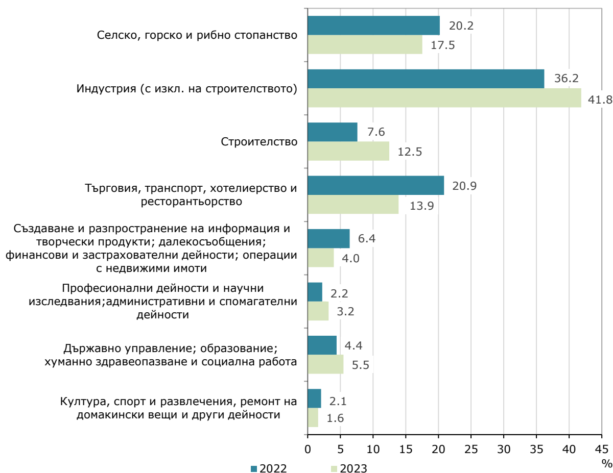
Фиг. 1. Структура на разходите за придобиване на дълготрайни материални активи през 2022 и 2023 г. по икономически дейности

Най-голям обем инвестиции в ДМА са вложени в промишления сектор - 195.5 млн. лева, което е с 28.9% повече спрямо 2022 година. Следващ по обем на направените инвестиции за ДМА е сектор „Селско, горско и рибно стопанство“ - 81.8 млн. лева, като в сравнение с предходната година е регистрирано намаление с 3.4%.