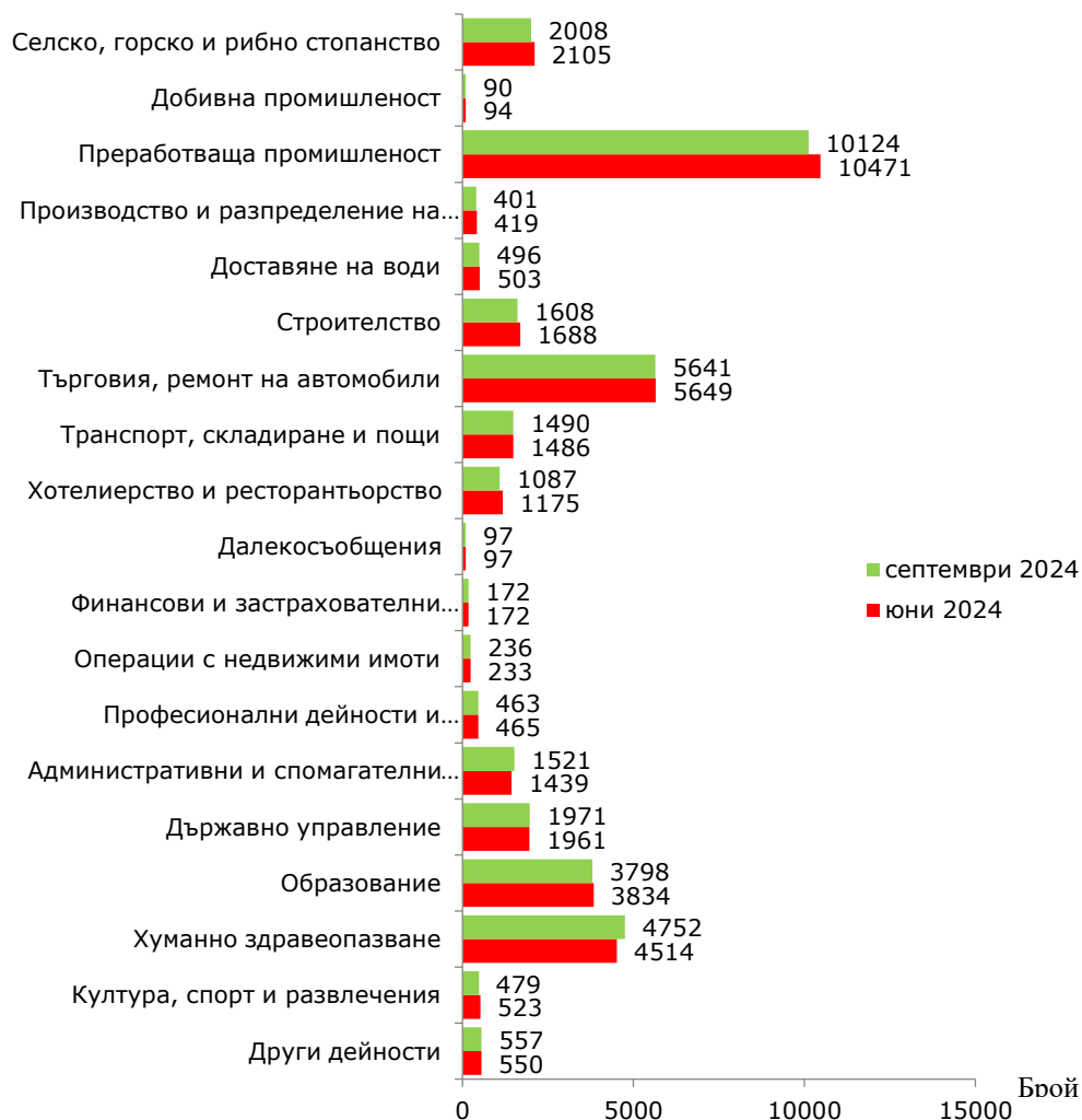
Фиг. 1. Наети лица по трудово и служебно правоотношение в област Сливен към края на юни и септември 2024 година

По предварителни данни на Националния статистически институт броят на наетите лица по трудово и служебно правоотношение в област Сливен към края на септември 2024 г. намалява с 0.4 хил., или с 1.0%, спрямо края на юни 2024 г., като достига 37.0 хиляди (фиг. 1).