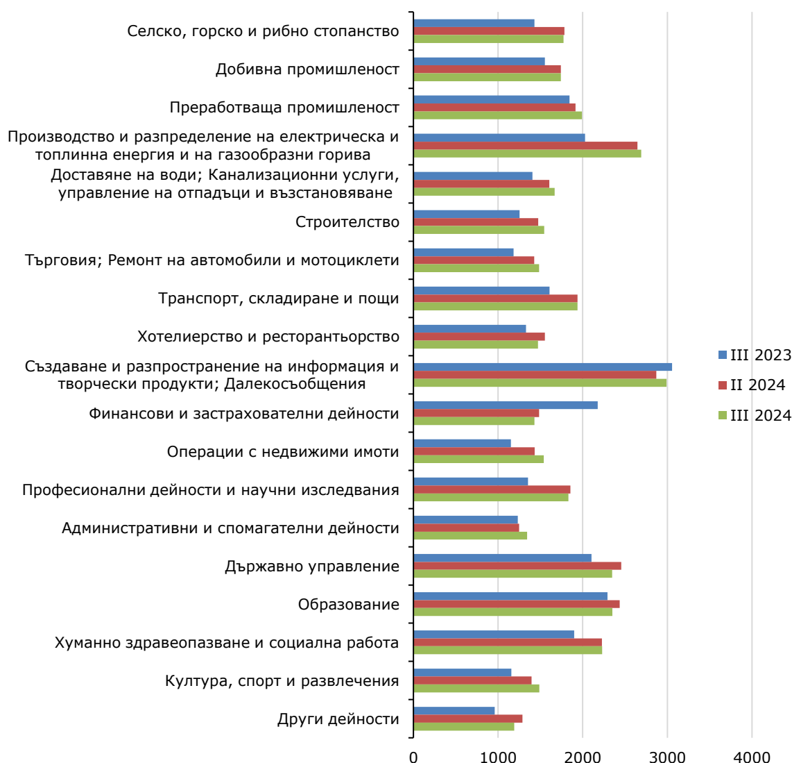
Фиг. 2. Средна брутна месечна работна заплата по икономически сектори в област Бургас - левове

Спрямо същия период на предходната година средната месечна работна заплата през третото тримесечие на 2024 г. нараства с 14.4%, в общественения сектор нарастването е с 10.7%, а в частния сектор - с 15.7%.