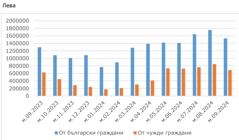
Фиг.2. Приходи от нощувки в местата за настаняване по месеци в област Велико Търново

Приходите от нощувки в област Велико Търново са 2 220.6 хил. лв., или с 15.4% повече в сравнение със септември 2023 година. Отчетено е увеличение на постъпленията от български граждани - с 18.0% и от чужди граждани - с 10.0%. Най-голяма част (55.0%) от реализираните приходи от нощувки през месеца в областта са постъпили в местата за настаняване, категоризирани с 1 и 2 звезди.