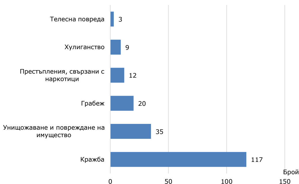
Фиг. 2 Малолетни и непълнолетни лица, преминали през ДПС, по някои видове престъпления през 2023 година в област Стара Загора

За престъпления свързани с наркотици през ДПС са преминали - 5.6% (12 лица).