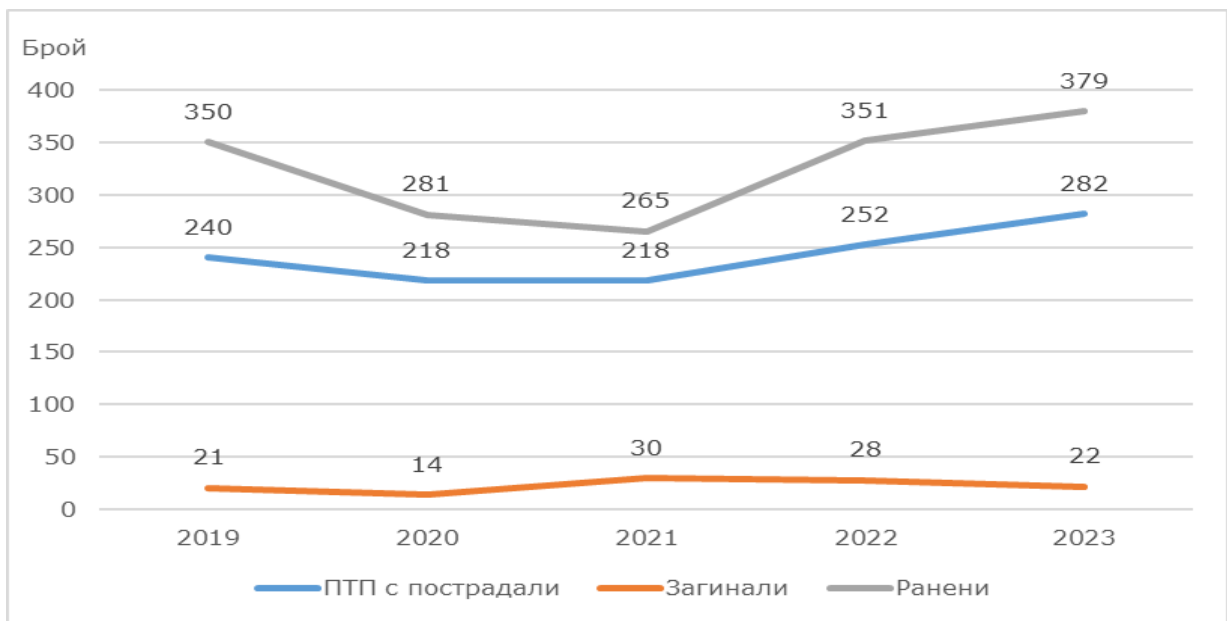
Фиг. 1. ПТП, загинали и ранени по години в област Велико Търново

През 2023 г. област Велико Търново е на 8-о място по брой тежки ПТП и по брой на ранени лица, а по брой загинали лица при ПТП се нарежда на 10-о място сред 28-те области в страната.