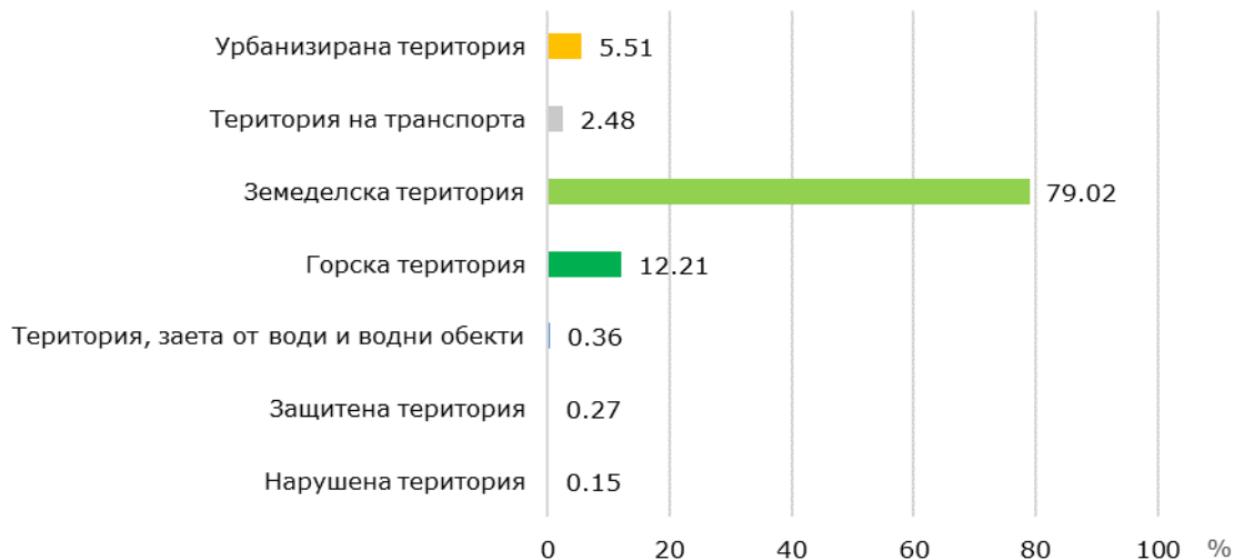
Фиг. 1. Баланс на територията по начин на трайно ползване на поземлените имоти на област Добрич към 31.12.2023 година

Според начина на трайно ползване (конкретно предназначение) на поземлените имоти, най-голяма площ заемат земеделските територии - 3 725.33 кв. км, или 79.02% от територията на областта. По дял на земеделските територии област Добрич е на второ място в страната. В областта най-голяма земеделска територия заема община Добрич-селска с 986.89 кв. км, следвана от община Генерал Тошево с 838.34 кв. км, а най-малка е община Добрич с 71.88 кв. км.