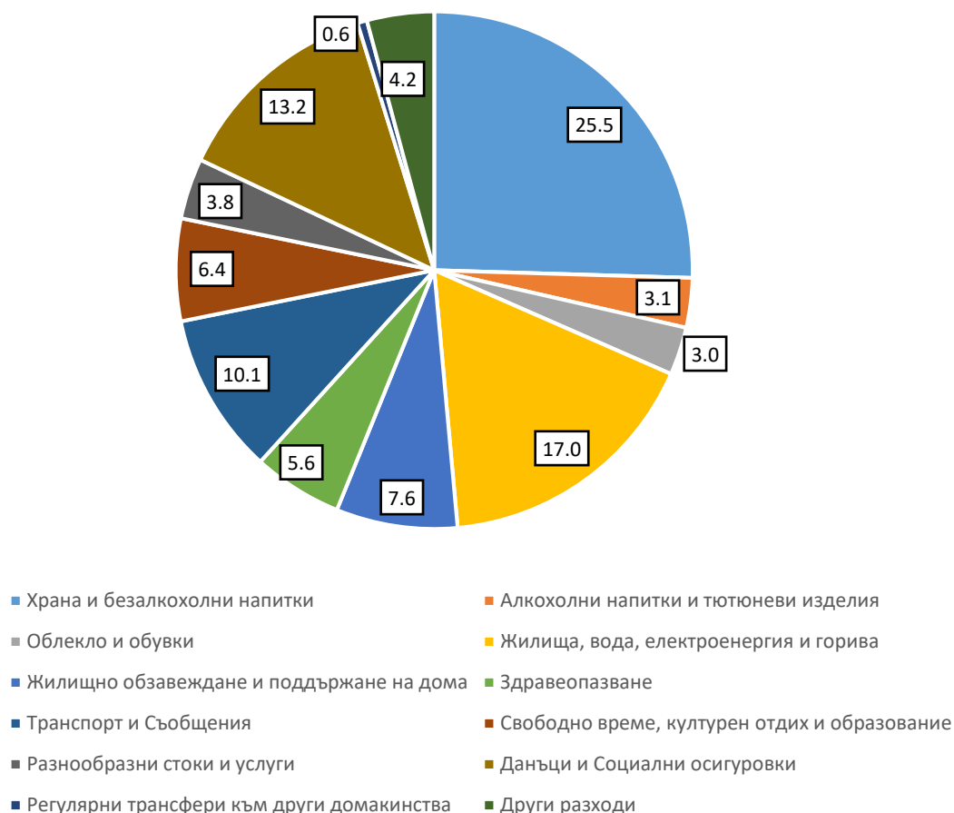
Фиг. 2. Структура на общия разход на домакинствата през 2023 година

През 2023 г. делът на разходите за транспорт и съобщения е 10.1% от общия разход, което е с 1.6 процентни пункта по-малко в сравнение с 2022 г. и с 0.6 процентни пункта спрямо 2014 година.