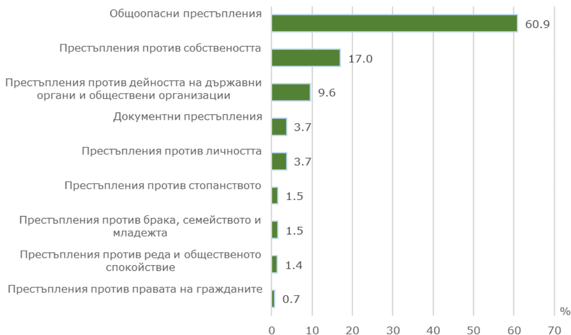
Фиг. 1. Структура на осъдените лица през 2023 г. по глави от НК в област Добрич