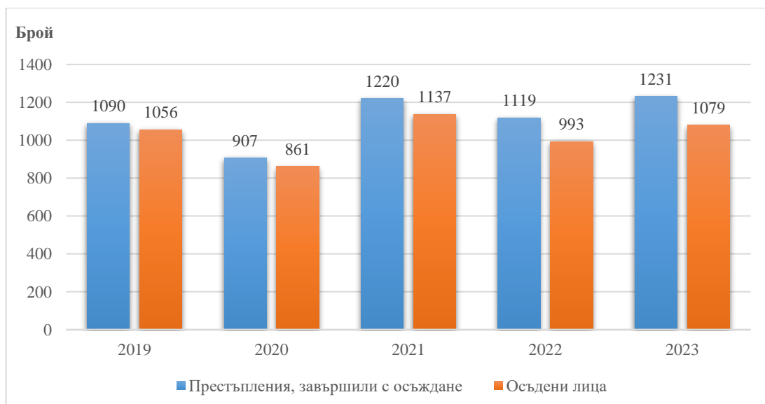
Фиг.1. Престъпления, завършили с осъждане, и осъдени лица в област Плевен през периода 2019 – 2023 година

През 2023 г. броят на осъдените лица с влезли в сила присъди в област Плевен е 1079.