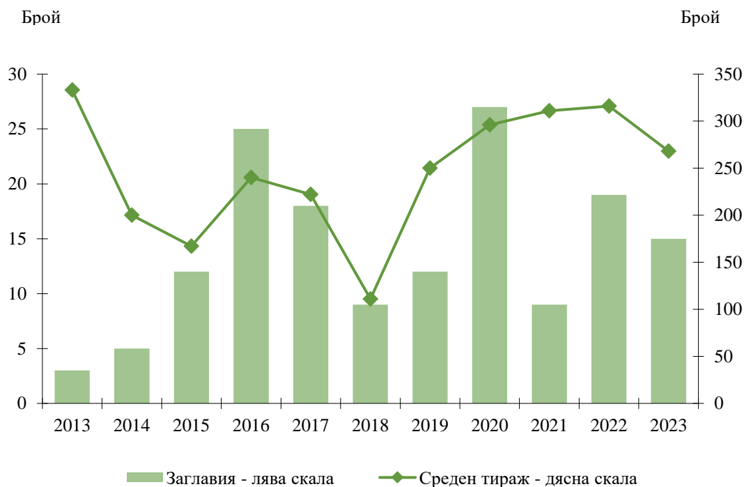
Фиг. 1. Издадени заглавия книги и брошури и среден тираж 1 на една книга и брошура в област Перник през периода 2013 - 2023 година

Относителният дял на издадените заглавия книги към общия брой за страната достига 0.2%, а този на издадените брошури е 0.1%. През предходната 2022 г. тези дялове са били 0.1 и 0.6%.