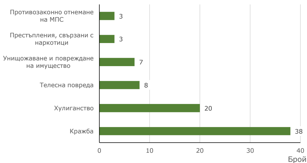
Фиг. 2. Малолетни и непълнолетни лица, преминали през ДПС, по някои видове престъпления през 2023 година

от магазини или други търговски обекти - 36.8% (14 лица), и джебчийски кражби - 10.5% (4 лица).