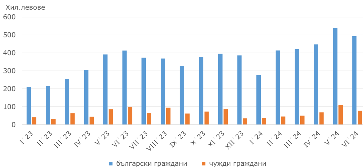
Фиг.2. Приходи от нощувки в местата за настаняване в област Враца по месеци