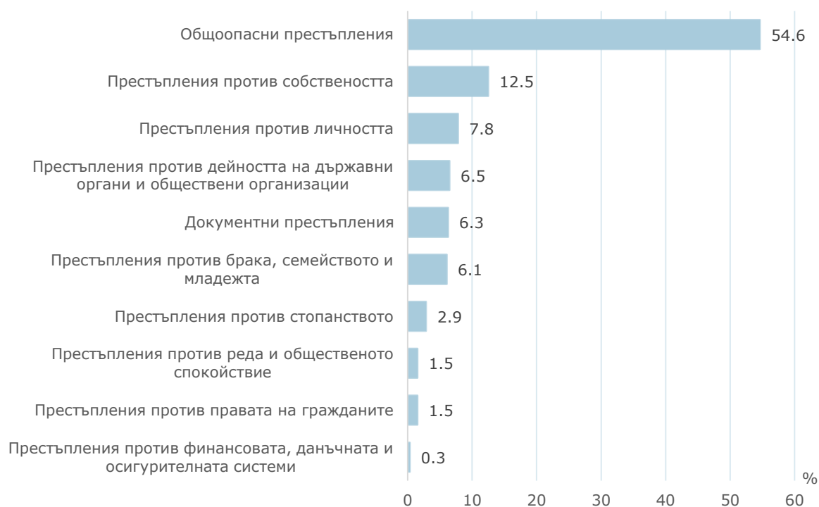
Фиг. 3. Структура на престъпленията, завършили с осъждане през 2023 г. по глави от НК

За извършването на общопасни престъпления са наказани 445 лица, или 55.5%. На второ място в структурата са осъдените за престъпления против собствеността - 129 лица (16.1%).