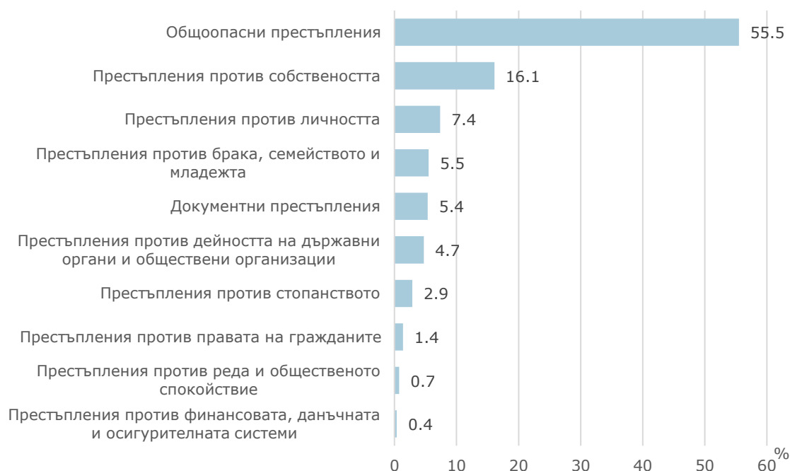
Фиг. 4. Структура на осъдените лица през 2023 г. по глави от НК

Осъдени за престъпления против реда и общественото спокойствие са 6 лица, а за извършването на престъпления против финансовата, данъчната и осигурителната система - 3 лица.