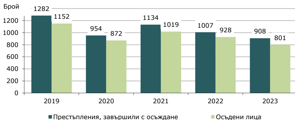
Фиг. 1. Престъпления, завършили с осъждане, и осъдени лица в област Благоевград през периода 2019 - 2023 година

През 2023 г. броят на осъдените лица с влезли в сила присъди в област Благоевград е 801. Осъдените непълнолетни лица (14 - 17 години) са 23, или 2.9% от всички осъдени.