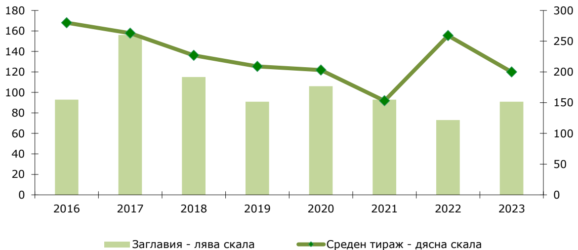
Фиг. 1. Издадени заглавия книги и брошури и среден тираж 1 на една книга и брошура в област Благоевград през периода 2016 - 2023 година

В сравнение с предходната година през 2022 г. броят на издадените в областта книги и брошури се увеличава с 18 (24.7%), докато средният им тираж бележи намаление с 22.8% и достига 200.