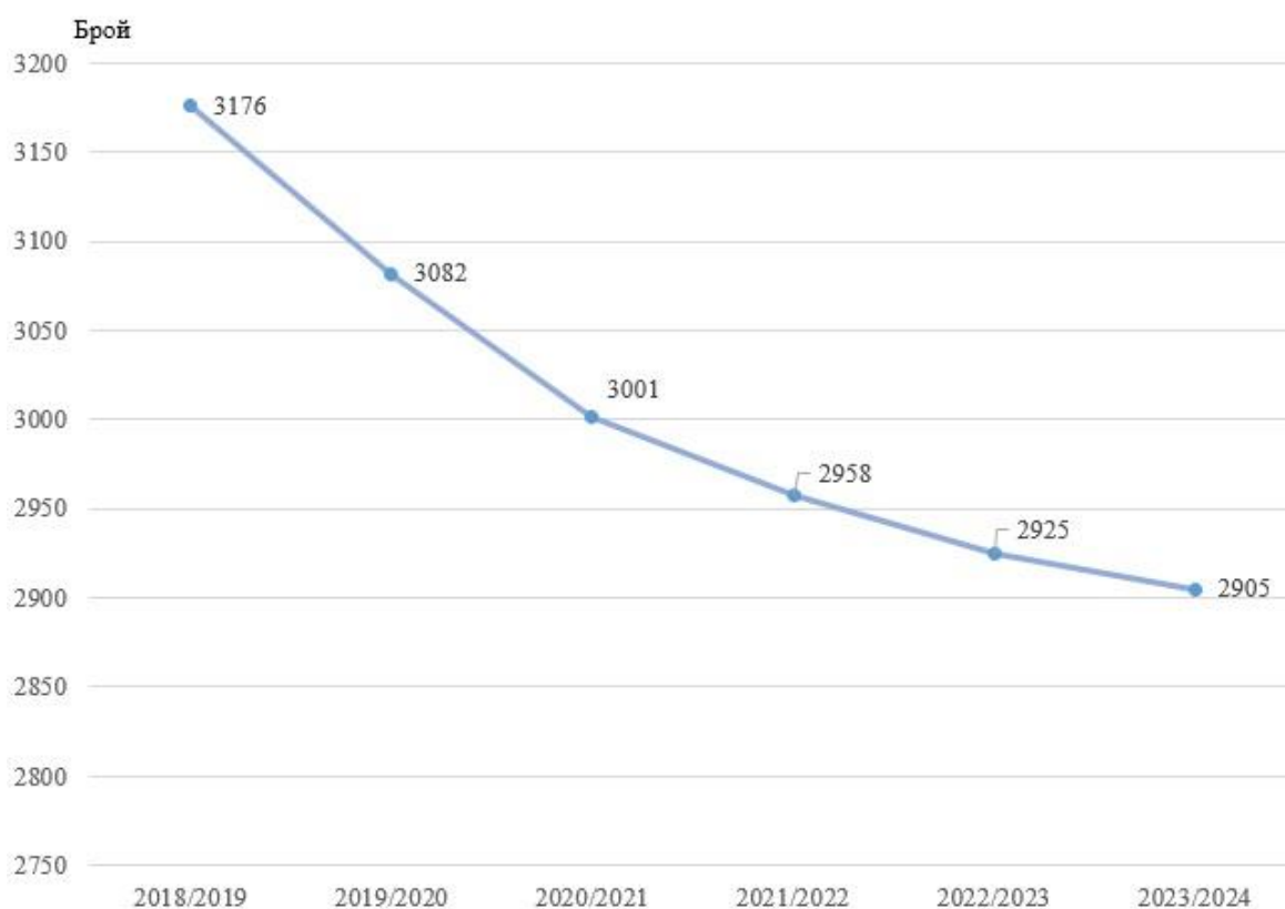
Фиг. 1. Деца в детските градини

Броят на детските градини в градовете на област Търговище е 17, със 99 групи, а в селата на областта функционират 4 детски градини със 37 групи.