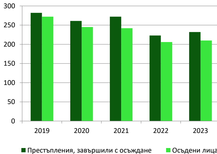
Фиг. 1. Престъпления, завършили с осъждане и осъдени лица в област Смолян през периода 2019 - 2023 година

Обвиняемите лица в област Смолян през 2023 г. са 330. От тях с ефективна осъдителна присъда са приключили делата на 66 лица или 20.0% от общия брой на обвиняемите, на 144 лица - с условно осъждане (43.6%), 111 лица са освободени от наказание (33.6%), 6 лица са оправдани (1.8%), а за 3 лица (0.9%) делата са прекратени.