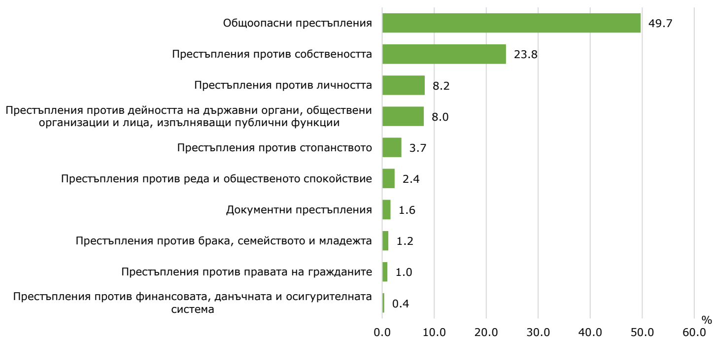
Фиг. 3. Структура на осъдените лица през 2023 г. по глави от НК

За извършването на общопасни престъпления са наказани 242 лица, или 49.7%. На второ място в структурата са осъдените за престъпления против собствеността - 116 лица (23.8%).