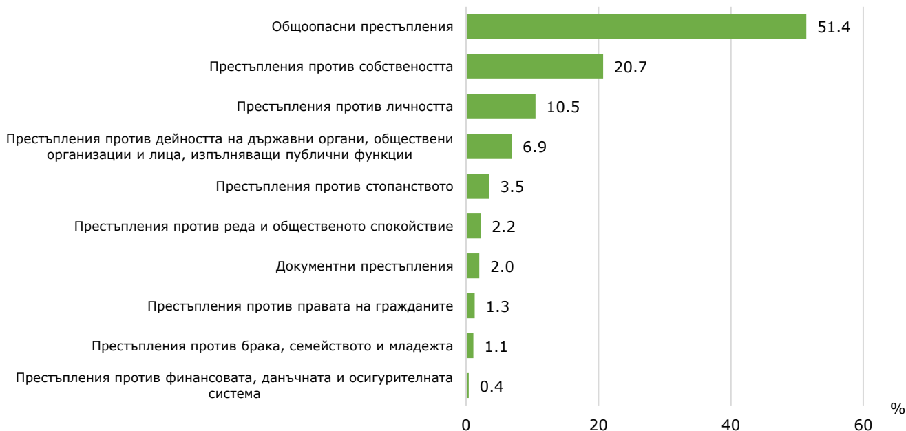
Фиг. 2. Структура на престъпленията, завършили с осъждане в област Кюстендил през 2023 г. по глави от НК

С осъждане са завършили 56 престъпления против личността , което представлява 10.5% от всички наказани престъпления.