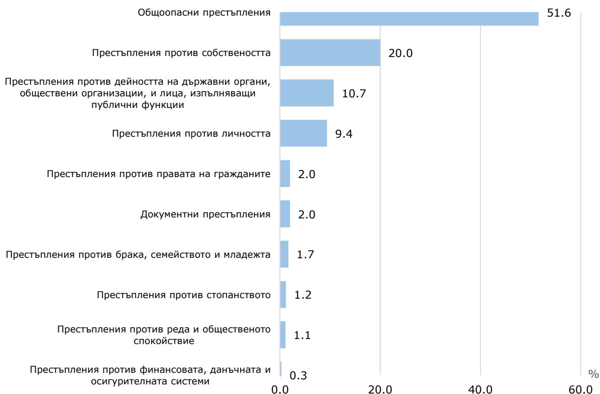
Фиг. 3. Структура на престъпленията, завършили с осъждане през 2023 г. по глави от НК

Почти половината от осъдените са наказани за извършването на общопасни престъпления - 747, или 49.8%. На второ място в структурата са осъдените за престъпления против собствеността - 350 лица (23.3%).