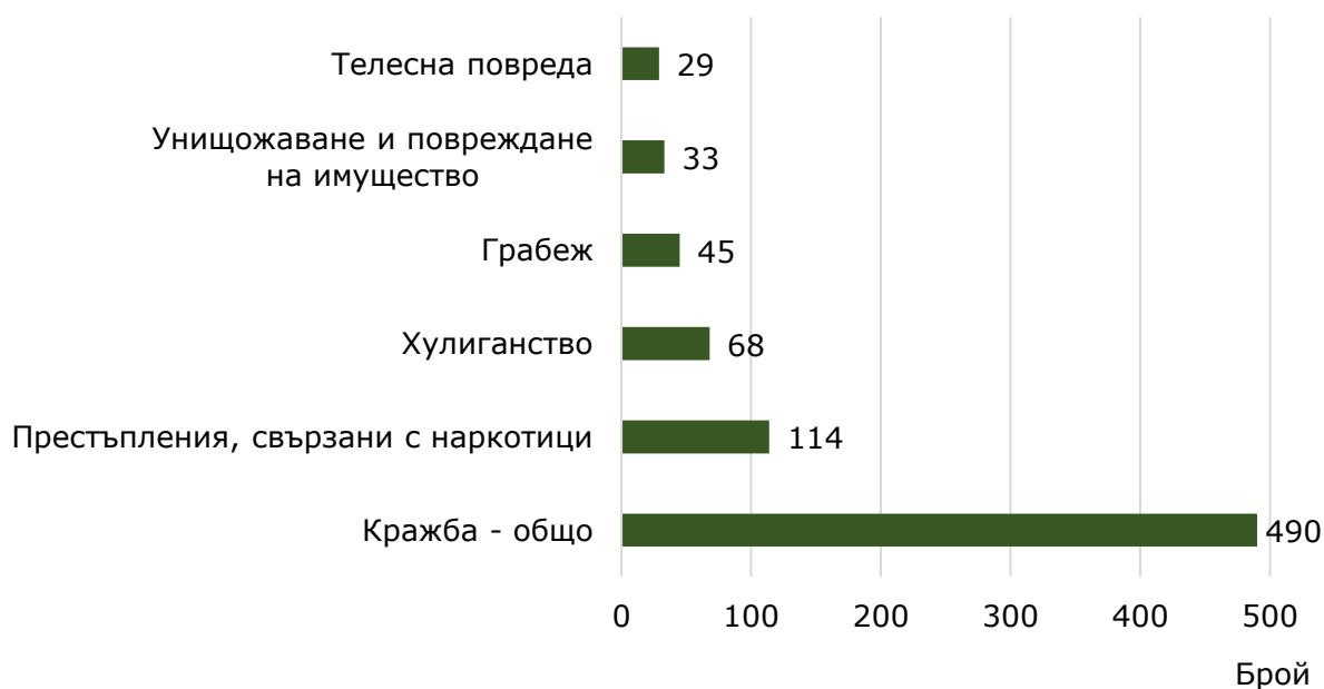
Фиг. 2. Малолетни и непълнолетни лица, преминали през ДПС, по някои видове престъпления през 2023 година

Кражбите на имущество са най-разпространените престъпления, извършвани от лицата на възраст 8 - 17 години. Извършители на кражби са 490 лица, или 59.1% от всички лица, преминали през ДПС за извършени престъпления. Най-висок е дялът на извършителите на кражби от магазини или други търговски обекти - 90.0% (441 лица).