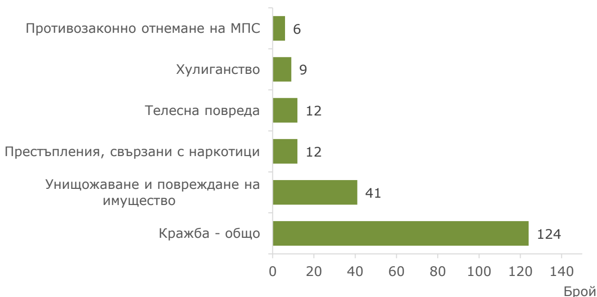
Фиг. 2. Малолетни и непълнолетни лица, преминали през ДПС, по някои видове престъпления през 2023 година