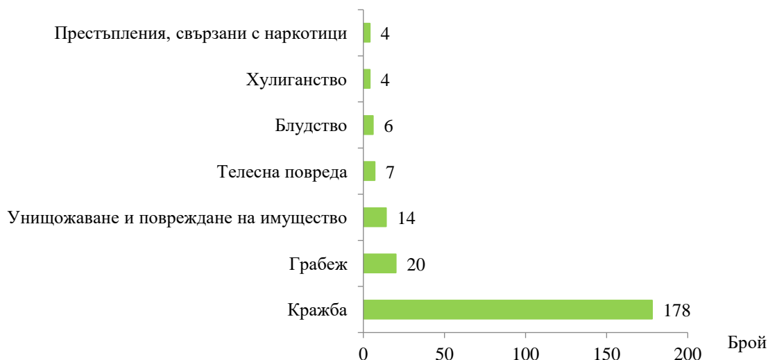
Фиг. 2. Малолетни и непълнолетни, преминали през ДПС, по някои видове престъпления през 2022 година

Пострадалите от престъпления малолетни и непълнолетни лица през 2022 г. са 70, от които 52, или 74.3% са момичета. Относителният дял на малолетните, пострадали от престъпления, е 42.9% (30 лица), а на непълнолетните – 57.1%, или 40 лица. Най-голям е броят и дялът на пострадалите от нанесени телесни повреди - 5 лица (7.1%) и от кражба и грабеж - по 4 лица (5.7%).