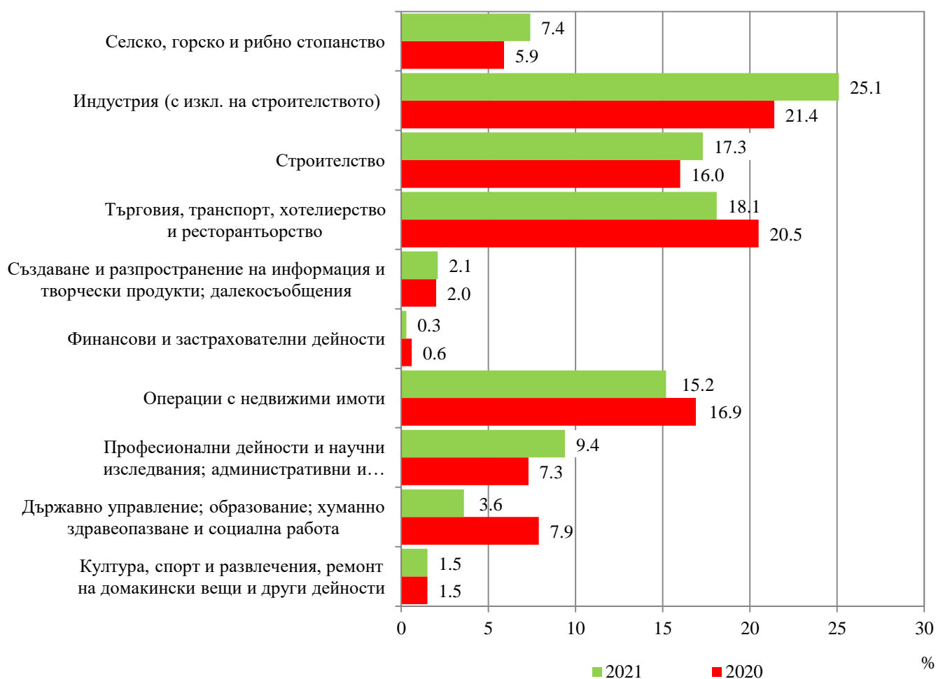
Фиг. 1. Структура на разходите за придобиване на дълготрайни материални активи през 2020 и 2021 година по икономически дейности

Най-голям обем инвестиции в ДМА са вложени в промишления сектор - 316.3 млн. лв., следван от сектора на услугите (търговия, ремонт на автомобили и мотоциклети, транспорт, складиране и пощи, хотелиерство и ресторантьорство) с 228.9 млн. лева. През 2021 г. тези сектори заедно формират 43.2% от общия обем разходи за ДМА.