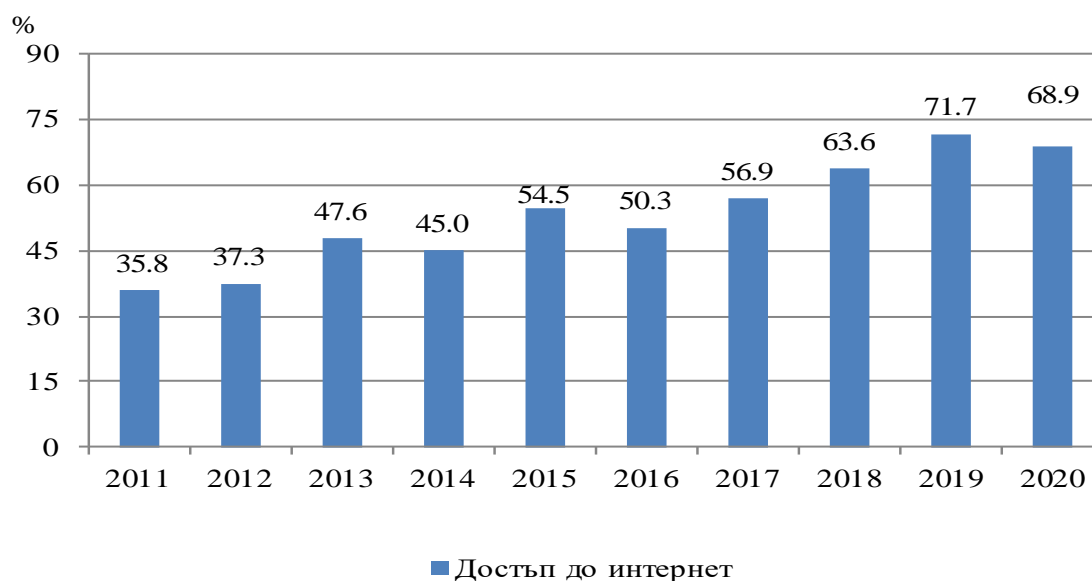
Фиг. 1. Относителен дял на домакинствата с достъп до интернет в област Плевен по години

През 2020 г. 63.2% от лицата на възраст между 16 и 74 навършени години в област Плевен използват интернет всеки ден или поне веднъж седмично на работа, вкъщи или на друго място. В регулярното използване на интернет от лицата в сравнение с предходната година е регистриран спад от 1.7 проценти пункта.