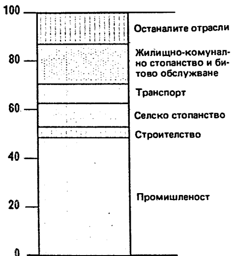
СТРУКТУРА НА КАПИТАЛНИТЕ ВЛОЖЕНИЯ ПРЕЗ 1990 Г. ПО ОТРАСЛИ проценти