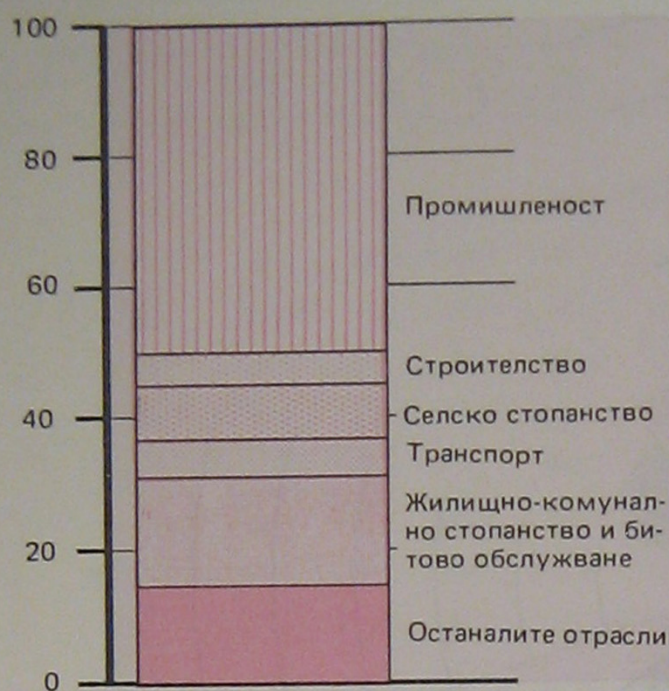
СТРУКТУРА НА КАПИТАЛНИТЕ ВЛОЖЕНИЯ ПРЕЗ 1989 Г. ПО ОТРАСЛИ проценти