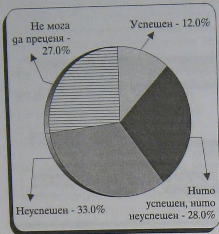
Фиг. 4а. Как оценявате хода на здравната реформа?

Висок е относителният дял на тези, които не приемат необходимостта от здравна реформа (64%). По-голяма част от анкетиранияте не оценяват положително хода на реформата към сегашния момент. В същото време около 1/3 от запитаните вярват в бъдещето на новата здравна система, докато по-малко от 1/5 са песимистично настроени (фиг. 4а, 4б).