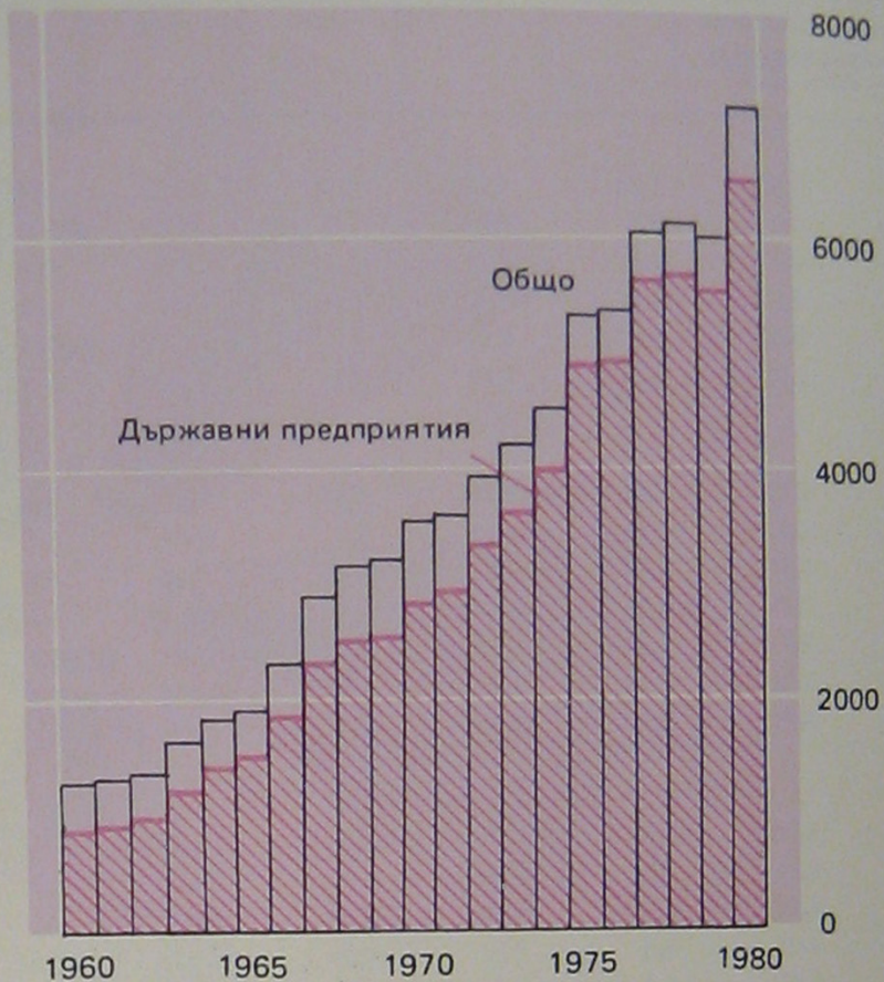
КАПИТАЛНИ ВЛОЖЕНИЯ В НАРОДНОТО СТОПАНСТВО млн. левове