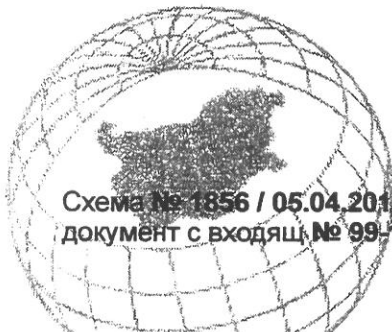
Схема № 1856 / 05.04.2012 г. е издадена въз основа на документ с входящ № 99-1597 / 02.04.2012 г.

Акт за публична държавна собственост (при първоначална регистр.) № 83 от 10.01.2000г., издаден от ОБЛАСТНА АДМИНИСТРАЦИЯ ГАБРОВО