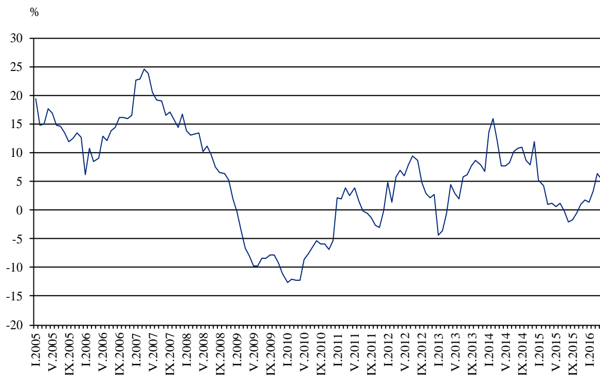
Фиг. 3. Изменение на оборота в раздел „Търговия на дребно, без търговията с автомобили и мотоциклети” спрямо съответния месец на предходната година (Календарно изгледени)

През април 2016 г. спрямо същия месец на 2015 г. оборотът нараства по-значително при: търговията на дребно с текстил, облекло, обувки и кожени изделия - с 21.1%, търговията на дребно с хранителни стоки, напитки и тютюневи изделия - с 13.2%, и търговията на дребно чрез поръчки по пощата, телефона или интернет - с 8.3%. Намаление е регистрирано при: търговията на дребно с компютърна и комуникационна техника - с 8.4%, търговията на дребно с разнообразни стоки - с 6.6%, и търговията на дребно с битова техника, мебели и други стоки за бита - с 2.2%.