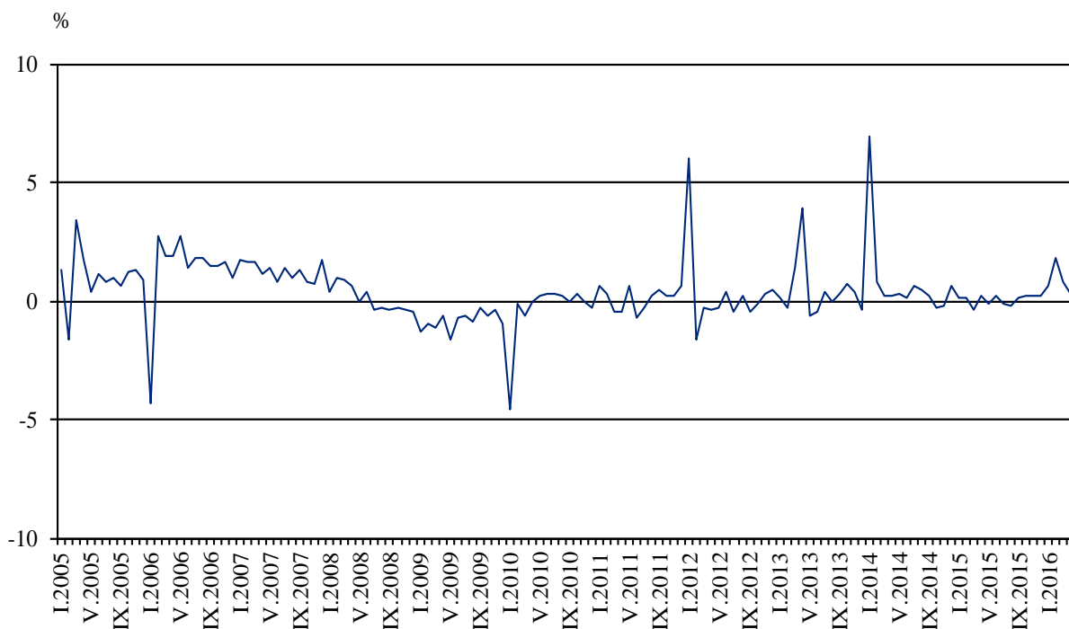
Фиг. 2. Изменение на оборота в раздел „Търговия на дребно, без търговията с автомобили и мотоциклети” спрямо предходния месец (Сезонно изгладени)

През април 2016 г. оборотът нараства по-значително спрямо предходния месец при: търговията на дребно чрез поръчки по пощата, телефона или интернет - с 3.8%, търговията на дребно с компютърна и комуникационна техника - с 3.0%, и търговията на дребно с текстил, облекло, обувки и кожени изделия - с 2.5%. Намаление е регистрирано при: търговията на дребно с разнообразни стоки - с 0.9%, търговията на дребно с фармацевтични и медицински стоки - с 0.8%, и търговията на дребно с битова техника, мебели и други стоки за бита - с 0.7%.