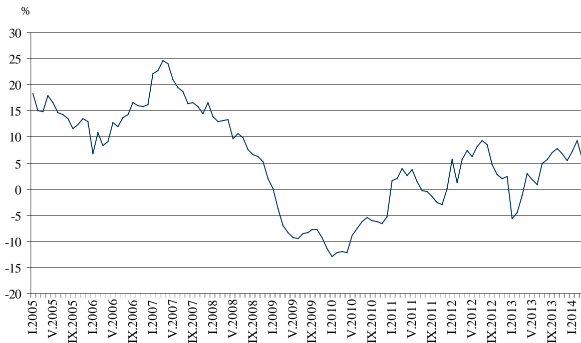
Фиг. 3. Изменение на оборота в раздел „Търговия на дребно, без търговията с автомобили и мотоциклети” спрямо съответния месец на предходната година (Календарно изгледени)

През март 2014 г. спрямо същия месец на 2013 г. оборотът нараства в почти всички икономически групи. По-значителен ръст се наблюдава в търговията на дребно с компютърна и комуникационна техника - с 20.4%, в търговията на дребно чрез поръчки по пощата, телефона или интернет - със 17.8%, в търговията на дребно с фармацевтични и медицински стоки - с 8.4% и в търговията на дребно с хранителни стоки, напитки и тютюневи изделия - с 5.6%. Спад е регистриран в търговията на дребно с автомобилни горива и смазочни материали - с 3.0%.