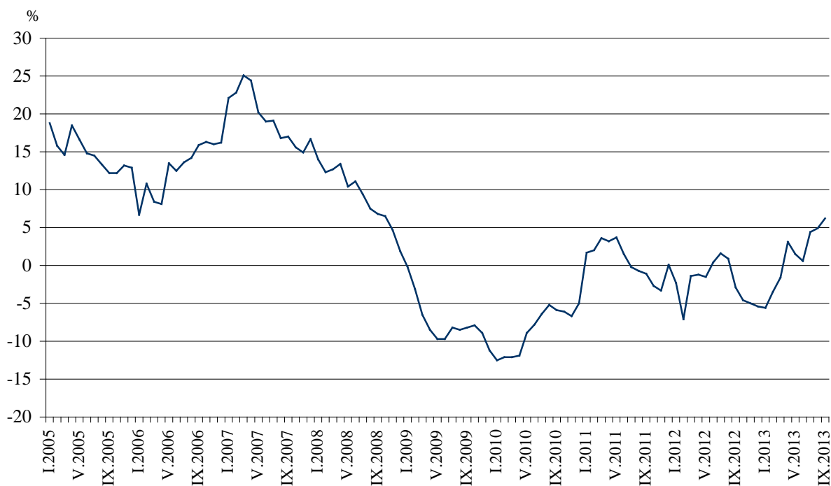
Фиг. 3. Изменение на оборота в раздел „Търговия на дребно, без търговията с автомобили и мотоциклети” спрямо съответния месец на предходната година (Календарно изгледени)

През септември 2013 г. спрямо същия месец на 2012 г. оборотът нараства във всички икономически групи. По-значителен ръст се наблюдава в: търговията на дребно с текстил, облекло, обувки и кожени изделия - с 27.6%, търговията на дребно с разнообразни стоки - с 13.0%, търговията на дребно с хранителни стоки, напитки и тютюневи изделия - с 8.0%, търговията на дребно с автомобилни горива и смазочни материали - със 7.3%, търговията на дребно с битова техника, мебели и други стоки за бита - с 5.0%.