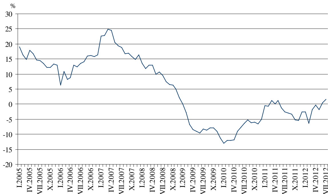
Фиг. 3. Процентно изменение на оборота в раздел „Търговия на дребно, без търговията с автомобили и мотоциклети” спрямо съответния месец на предходната година (Календарно изгледени)

През юли 2012 г. спрямо същия месец на 2011 г. оборотът отбелязва ръст в търговията на дребно чрез поръчки по пощата, телефона или интернет - с 19.7%, в търговията на дребно с фармацевтични и медицински стоки - с 10.9%, в търговията на дребно с автомобилни горива и смазочни материали - с 6.6%, в търговията на дребно с компютърна и комуникационна техника - с 6.4%, и в търговията на дребно с храни, напитки и тютюневи изделия - с 1.8%. Спад се наблюдава в търговията на дребно с текстил, облекло, обувки и кожени изделия - с 15.8%, в търговията на дребно с разнообразни стоки - със 7.1%, и в търговията на дребно с битова техника, мебели и други стоки за бита - с 6.5%.