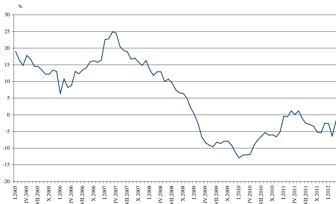
Фиг. 3. Процентно изменение на оборота в раздел „Търговия на дребно, без търговията с автомобили и мотоциклети” спрямо съответния месец на предходната година (Календарно изгледени)

През март 2012 г. оборотът бележи ръст спрямо същия месец на 2011 г. в търговията на дребно чрез поръчки по пощата, телефона или интернет - с 9.5%, в търговията на дребно с фармацевтични и медицински стоки - с 8.4%, в търговията на дребно с компютърна и комуникационна техника - с 4.1%, и в търговията на дребно с храни, напитки и тютюневи изделия - с 1.8%. Спад отбелязва оборотът в търговията на дребно с текстил, облекло, обувки и кожени изделия - с 21.8%, в търговията на дребно с битова техника, мебели и други стоки за бита - с 12.1%, в търговията на дребно с разнообразни стоки - с 11.0%, и в търговията на дребно с автомобилни горива и смазочни материали - с 3.4%.