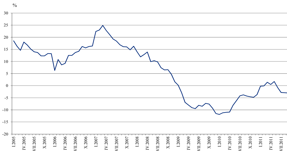
Фиг. 3. Процентно изменение на оборота в раздел „Търговия на дребно, без търговията с автомобили и мотоциклети” спрямо съответния месец на предходната година (Календарно изгледени)

Оборотът през септември 2011 г. спрямо същия месец на 2010 г. бележи ръст в търговията на дребно с фармацевтични и медицински стоки - с 6.0%, и в търговията на дребно с автомобилни горива и смазочни материали - с 1.6%. Спад е регистриран в търговията на дребно с битова техника, мебели и други стоки за бита - с 11.1%, в търговията на дребно с текстил, облекло, обувки и кожени изделия - с 8.0%, в търговията на дребно с компютърна и комуникационна техника - с 4.2%, и в търговията на дребно с храни, напитки и тютюневи изделия - с 2.4%.