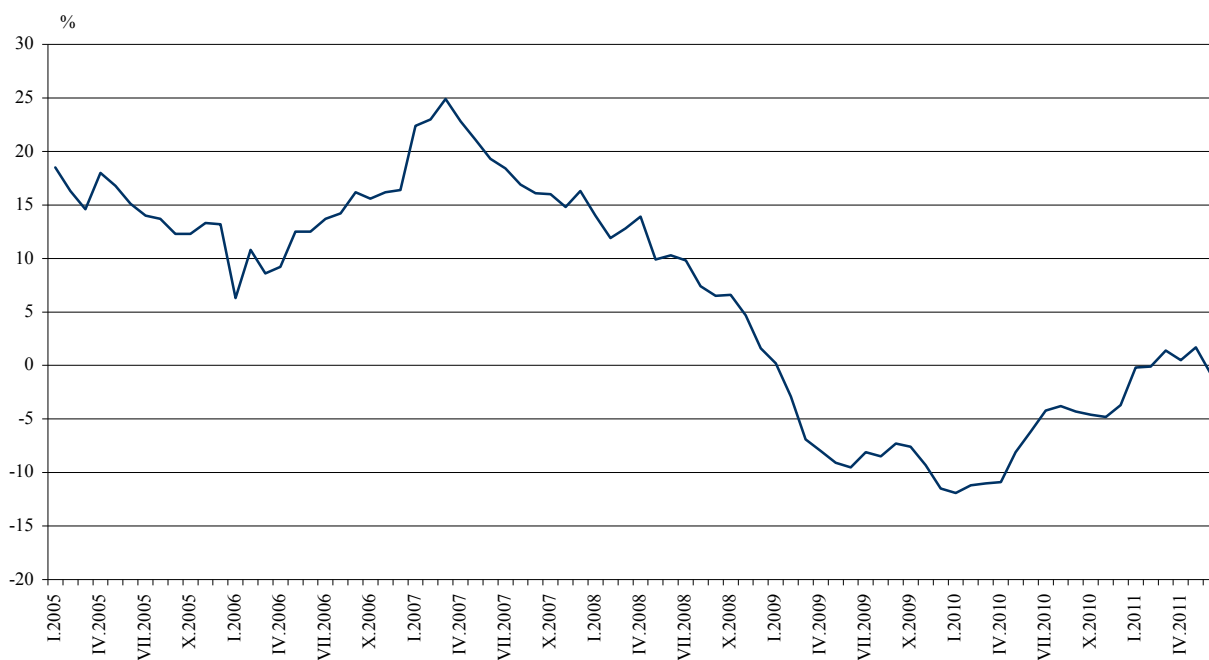
Фиг. 3. Процентно изменение на оборота в раздел „Търговия на дребно, без търговията с автомобили и мотоциклети” спрямо съответния месец на предходната година (Календарно изгладени)

Оборотът през юни 2011 г. спрямо същия месец на 2010 г. отбелязва ръст в търговията на дребно с фармацевтични и медицински стоки - с 4.3%, и в търговията на дребно с компютърна и комуникационна техника - с 2.7%. Спад е регистриран в търговията на дребно с битова техника, мебели и други стоки за бита - с 4.5%, в търговията на дребно с текстил, облекло, обувки и кожени изделия - с 2.5%, в търговията на дребно с автомобилни горива и смазочни материали - с 1.8%, и в търговията на дребно с храни, напитки и тютюневи изделия - с 0.9%.