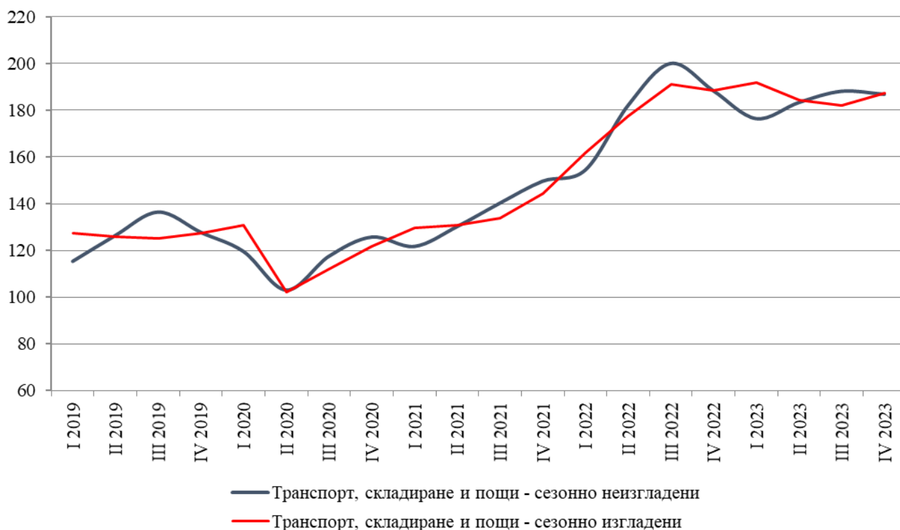
Фиг. 1. Тримесечен индекс на оборота за сектор „Транспорт, складиране и пощи“ (2015 = 100)

През четвъртото тримесечие на 2023 г. индексът на оборота за сектор „Транспорт, складиране и пощи“ нараства с 2.9% в сравнение с предходното тримесечие. Данните са предварителни и сезонно изгладени. Най-голямо увеличение е регистрирано при „Складиране и обработка на товари, спомагателни дейности в транспорта“ - със 7.5%, докато намаление се наблюдава само при „Въздушен транспорт“ - с 3.7%.