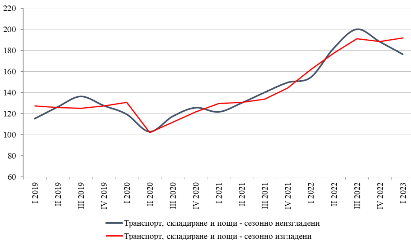
Фиг. 1. Тримесечен индекс на оборота за сектор „Транспорт, складиране и пощи“ (2015 = 100)

През първото тримесечие на 2023 г. индексът на оборота за сектор „Транспорт, складиране и пощи“ се увеличава с 1.2% в сравнение с предходното тримесечие. Данните са предварителни и сезонно изгладени. Най-голям ръст е регистриран при „Въздушен транспорт“ - със 17.0%. Намаление се наблюдава при „Воден транспорт“ - с 4.0%, и „Складиране и обработка на товари, спомагателни дейности в транспорта“ - с 0.8%.