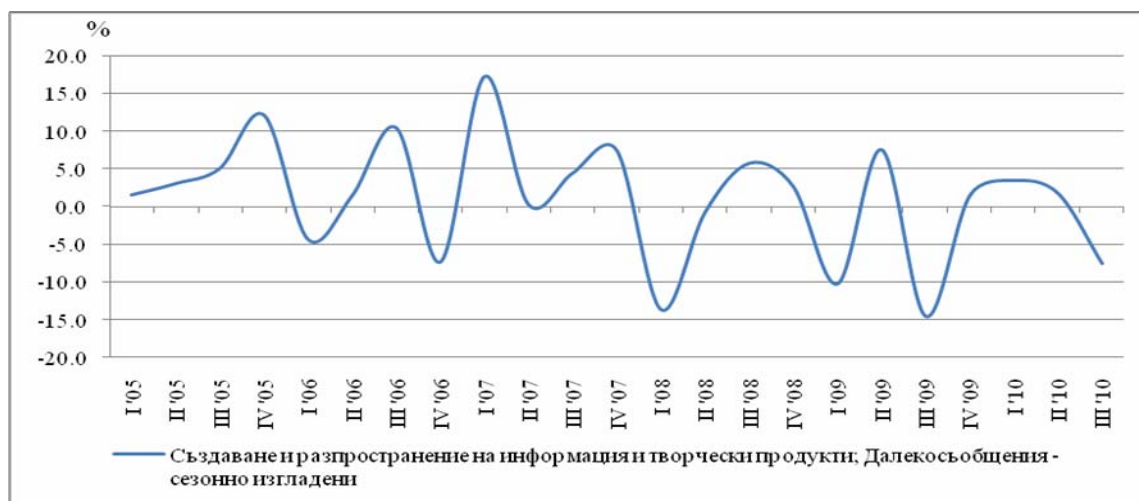
Фиг. 2. Процентно изменение на индекса на оборота в сектор „Създаване и разпространение на информация и творчески продукти; далекосъобщения” спрямо предходното тримесечие Сезонно изгладени

От „Другите бизнес услуги” най-висок ръст спрямо предходното тримесечие се наблюдава в „Други професионални дейности” и в „Дейности по наемане и предоставяне на работна сила”, съответно с 21.2 и 12.3%.