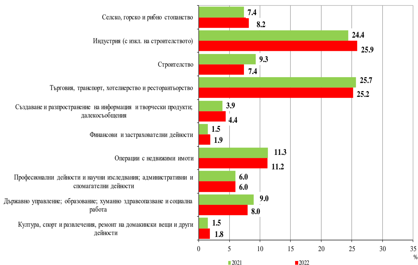
Фиг. 2. Структура на разходите за придобиване на дълготрайни материални активи през 2021 и 2022 г. по икономически дейности

Наблюдава се нарастване в структурата на разходите за ДМА в сектора на промишлеността, като относителният им дял се увеличава с 1.5 процентни пункта в сравнение с 2021 г., и спад в сектора на услугите (търговия, ремонт на автомобили и мотоциклети, транспорт, складиране и пощи, хотелиерство и ресторантьорство) с 0.5 процентни пункта.