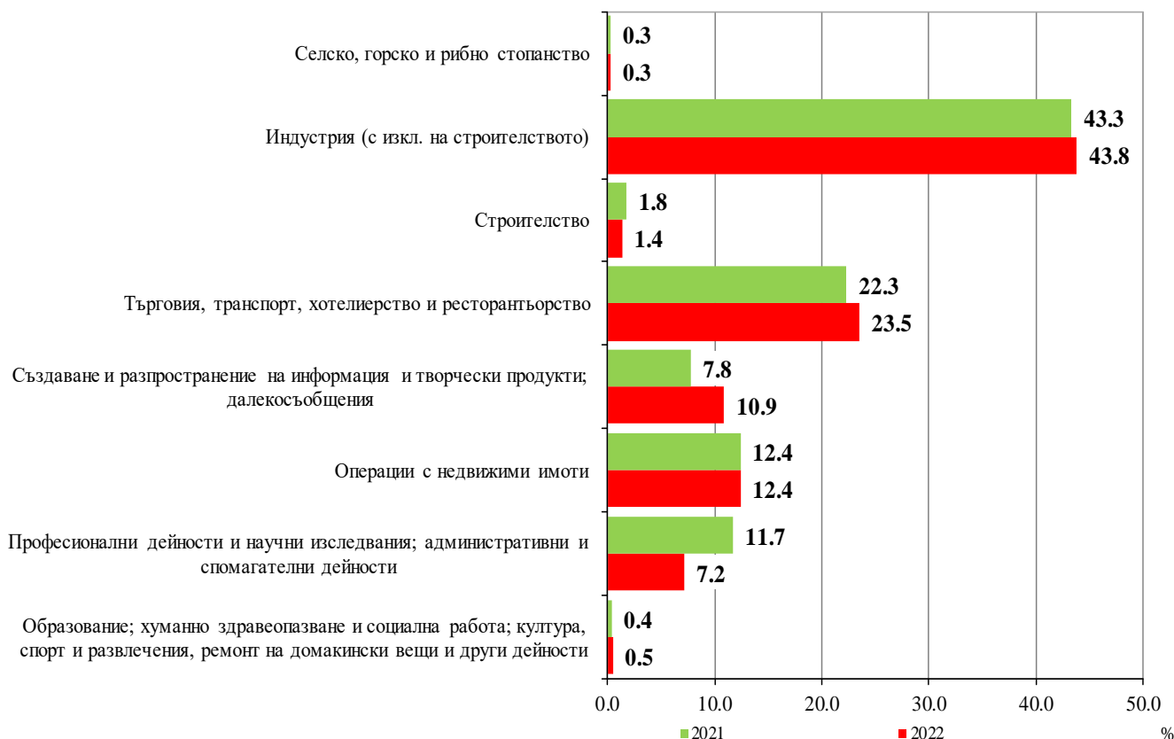
Фиг. 1. Структура на преките чуждестранни инвестиции в предприятията от нефинансовия сектор по икономически дейности към 31.12.

Направените инвестиции в сектор „Създаване и разпространение на информация и творчески продукти; далекосъобщения“ са с 3.1 процентни пункта повече в сравнение с предходната година, а в сектор „Строителство“ те намаляват с 0.4 процентни пункта.